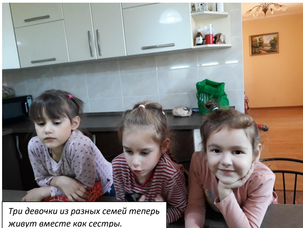
Три девочки из разных семей теперь живут вместе как сестры.

После окончания служения и праздничного обеда мы заехали в детский дом семейного типа, который находится в этом городе. Это стало нашей традицией заезжать в этот дом, когда мы бываем в Бендерах или Тирасполе. Как дети, так и их родители рады нам. Конечно же приезжаем мы не с пустыми руками. Однако они рады не столько нашим