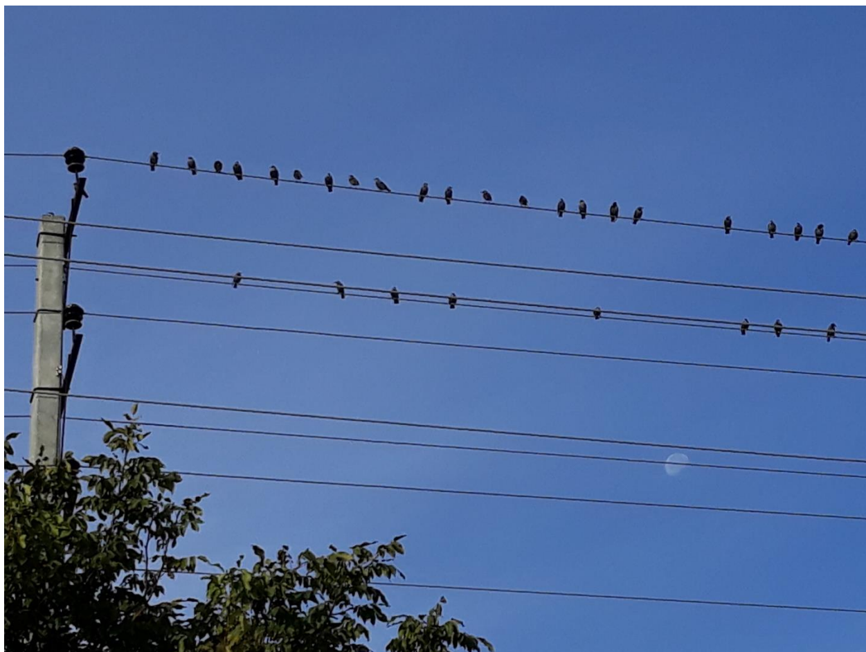
Птицы готовятся к перелету в теплые края на зимовку.