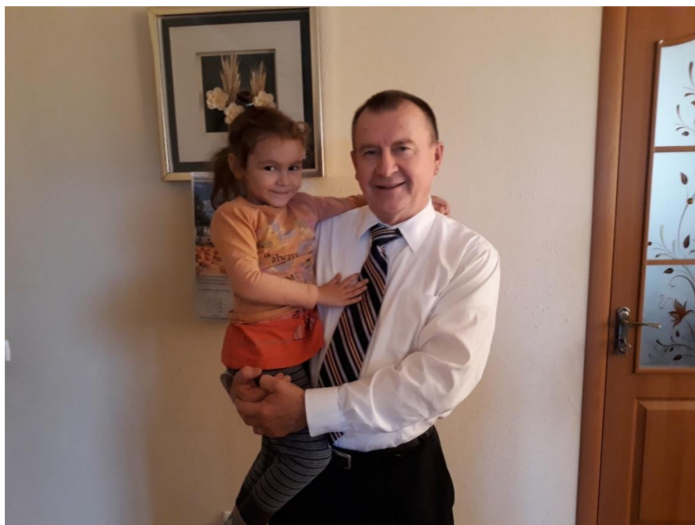
Этой 5-летней девочке очень не хотелось, чтобы дедушка и бабушка уезжали.

подаркам, сколько общению с нами. Для родителей – это возможность поделиться своими переживаниями и помолиться с нами. Для детей – это возможность посидеть на коленях дедушки и бабушки из Кишинева. А для нас это приятная возможность проявить любовь к этим маленьким деткам, которые так напоминают нам наших внуков в Америке.